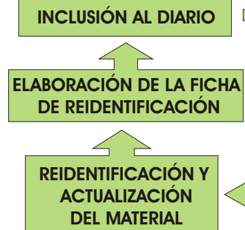
DIAGRAMA DE FLUJO DE LA